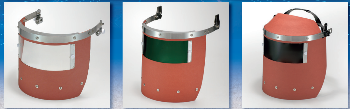
FB775T-6 アクリル透明 外寸 (H) 200×(W) 360 窓寸 (H) 80×(W) 200