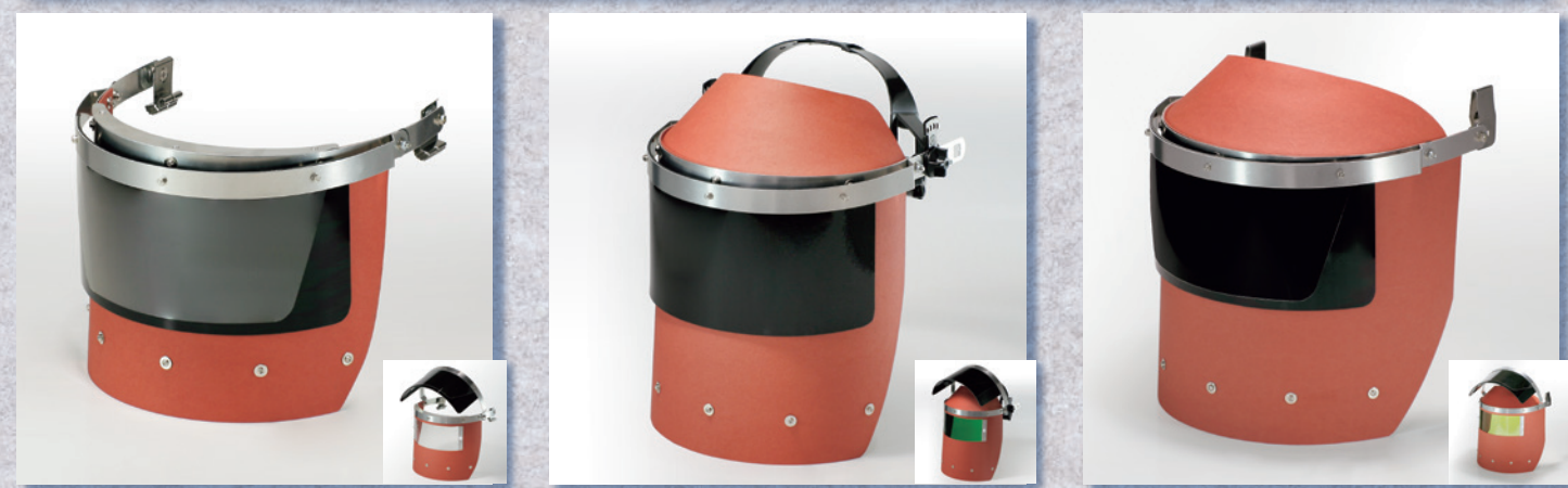
FB775WT-7 外IR8/内アクリル透明 外寸 (H) 200×(W) 360 窓寸 (H) 80×(W) 200 外レンズ (H) 125×(W) 280